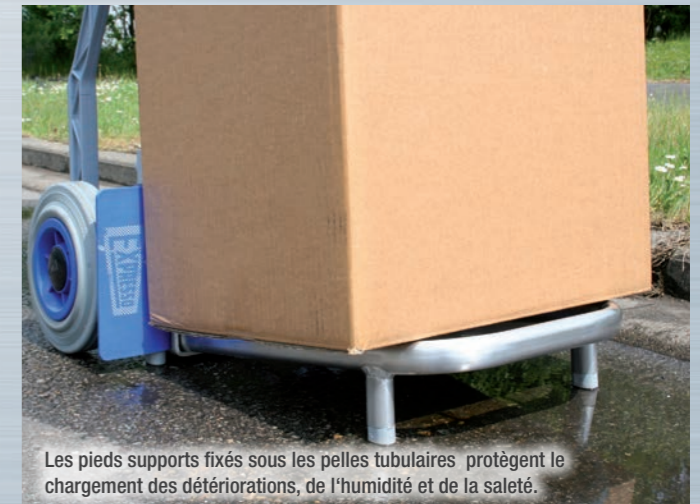
Les pieds supports fixés sous les pelles tubulaires protègent le chargement des détériorations, de l'humidité et de la saleté.