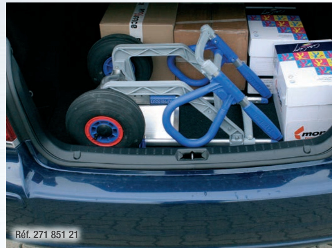
Réf. 271 851 21

Plaque publicitaire réf. 1080 en option pour personnalisation du diable