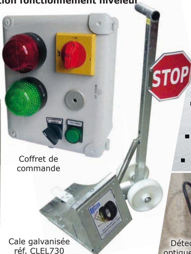
Coffret de commande