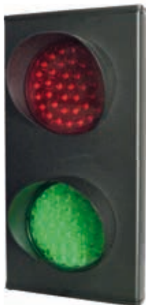
Feu extérieur bicolore