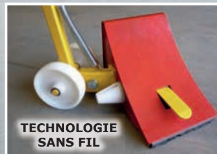
TECHNOLOGIE SANS FIL