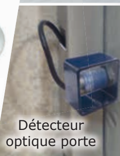
Détecteur optique porte